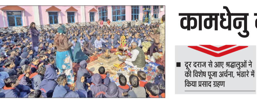
झज्जर। विद्यालय स्थापना दिवस पर आयोजित हवन में भाग लेते हुए शिक्षक व विद्यार्थी।

उन्होंने कहा कि कड़े बार मामूली तकनीकी खामियों और अधूरी साक्ष्य श्रृंखला के कारण गंभीर अपराधों में भी आरोपी बच निकलते हैं। इसलिए प्रारंभिक स्तर से ही केस फाइल मजबूत की जाए और अभियोजन पक्ष हर सुनवाई में सशक्त पैरवी सुनिश्चित करें।