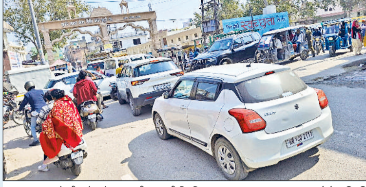
झज्जर। शहर के बीकानेर चौक पर बनी जाम की स्थिति।

इसके अलावा जाम की वजह से जहां वाहन चालक परेशान हैं, वहीं दुकानदारों की दुकानदारी भी प्रभावित हो रही है। दुकानदारों का कहना है कि पहले तो इस सड़क को कई दिनों तक उखाड़ कर रखा गया और निर्माण कार्य शुरू नहीं किया गया। जिसके कारण दुकानदारी पूर्णतया प्रभावित रही।