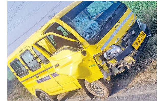
बहादुरगढ़। इस गाड़ी के साथ हुई विनोद की बाइक की टक्कर