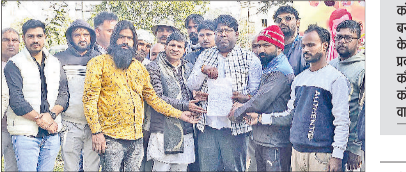
बहादुरगढ़। भाजपा नेताओं को ज्ञापन सौंपते कर्मचारी।

कर्मचारियों ने बताया कि वे वर्ष 2016 से निगम में सेवाएं दे रहे हैं, लेकिन अब तक स्थायी नियुक्ति नहीं हो पाई। जिस कंपनी के