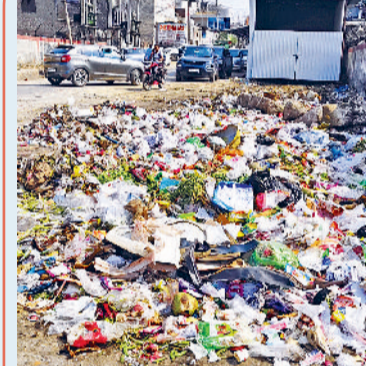
बहादुरगढ़। शहर के झज्जर रोड पर लगे गंदगी के ढेर।