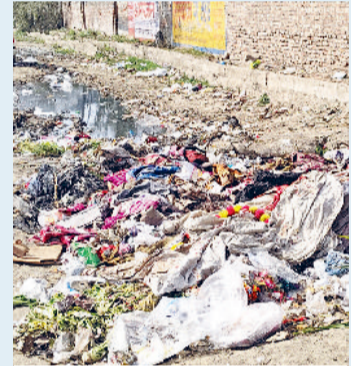
बहादुरगढ़। पुराने लघु सचिवालय में सड़क किनारे खुले में पड़ी गंदगी।