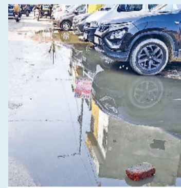
बहादुरगढ़। पुराने झज्जर रोड पर भरा सीवर का गंदा पानी।