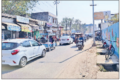
झज्जर। शहर के अंबेडकर चौक से बीकानेर चौक तक बनी जाम की स्थिति।

अब कुछ दिनों से निर्माण कार्य शुरू हुआ तो दुकानदारों को उम्मीद जगी कि जल्द सड़क का निर्माण पूरा हो जाएगा और उनका कामकाज पहले की तरह सुचारु हो जाएगा। लेकिन सड़क निर्माण कार्य इतनी धीमी गति से किया जा रहा है कि लगता नहीं कि यह सड़क जल्द बन जाएगी। संबंधित फर्म द्वारा कमी कार्य किया जाता है और कमी कार्य बंद कर दिया जाता है। जिसके कारण काफी परेशानी हो रही है। उन्होंने कहा कि पहले जहां दिन भर अच्छी बिक्री होती थी, अब आधे से भी कम रह गई है। उन्होंने कहा कि सड़क निर्माण से संबंधित फर्म को चाहिए था कि पहले वैकल्पिक यातायात व्यवस्था की जाती, फिर सड़क निर्माण शुरू किया जाता। जिससे दुकानदारों को परेशानी ना होती। उन्होंने जिला प्रशासन से सड़क निर्माण कार्य जल्द पूरा करने की गुहार लगाई है ताकि उनका कारोबार सुचारु रूप से चल सके।